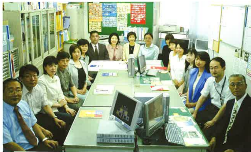
中国、韓国、台湾、イギリス、アメリカ、ニュージーランドと、海外生活経験者、留学経験者も多いです。異文化体験を持ったスタッフが、自立補助を目標に、生活指導に当たっています。

多彩な教師陣 専門分野の異なる教員の力を、日本語教育、留学生教育に結集しました。