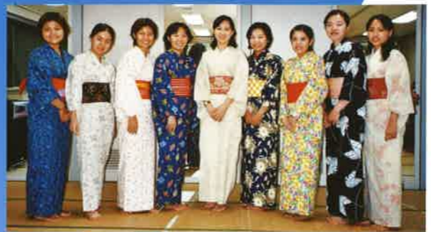
夏休みゆかた着付教室