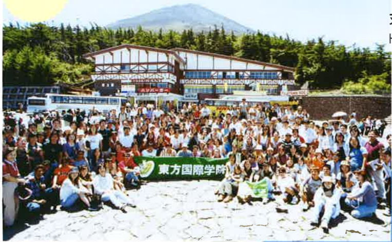
富士山バス旅行 Bus Tour to The Mt. Fuji