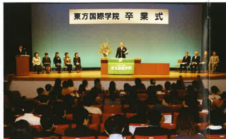
卒業式：教師も学生も喜びの日