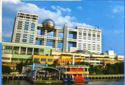
フジテレビ本社ビル The new Fuji Television Building