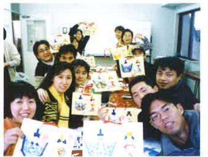
和紙でおひなさま