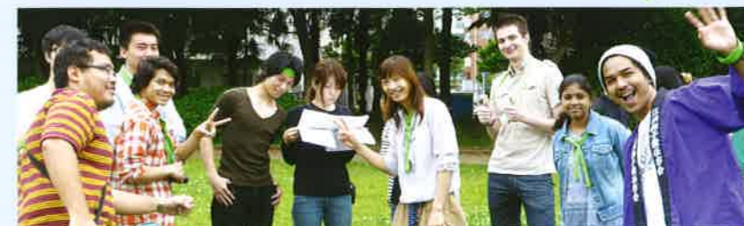
学生が国籍を越えて、親睦を深めるためのレクリエーション大会

中国、台湾、韓国、モンゴル、フィリピン、タイ、インドネシア、シンガポール、香港、マレーシア、ミャンマー、ベトナム、ネパール、インド、スリランカ、オーストラリア、ニュージーランド、カナダ、アメリカ、メキシコ、ペルー、ホンジュラス、コスタリカ、フランス、ロシア、世界各国から東方国際学院へ。トウホウファミリーは増え続けています。