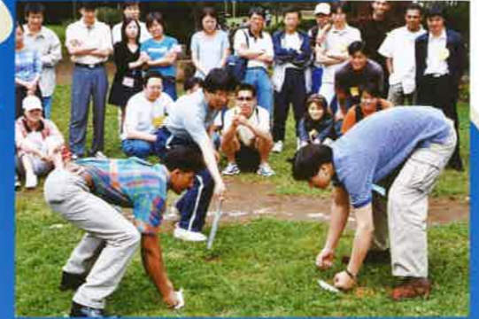
葛西臨海公園でクラス対抗相撲大会

勉強の合間に課外活動。 入学式、卒業式の儀式、1日バス旅行、都内見学、 パーティ、伝統行事の紹介等盛りだくさんです。