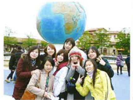
東京ディズニーシー