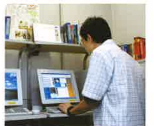
コンピューター室

授業が終わった。きょうの予定は？ 友達とでかけたり、アルバイトをしたり、 自習室で勉強したり、コンピューターで メールを送ったり。