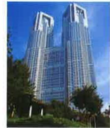
東京都庁 The Tokyo Metropolitan Government Office